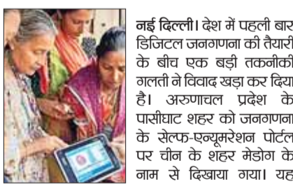
जुटि सामने आने के बाद सरकार ने ठीक किया