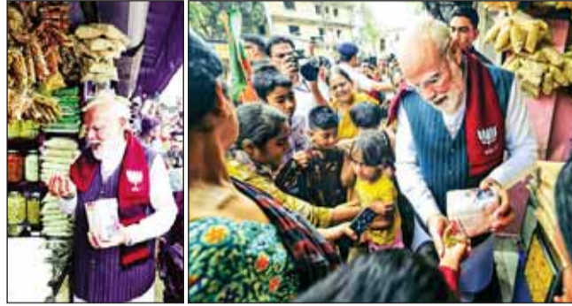
झालमुरी का स्वाद लेते हुए

जहां उन्होंने एक स्थानीय दुकान से झालमुरी खाई और आम लोगों से बातचीत की। पीएम मोदी ने दुकाने वाले को 10 रुपए भी दिए। इस दौरान उन्होंने लोगों के साथ झालमुरी को बांटा भी।