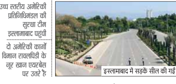
इस्लामाबाद में सड़कें सील की गई

हालांकि अभी तक अमेरिका, ईरान या पाकिस्तान ने आधिकारिक तौर पर इस बैठक की पुष्टि नहीं की है, लेकिन हालात साफ बता रहे हैं कि बड़ी बातचीत की तैयारी चल रही है। अभी यह साफ नहीं है कि इस बार अमेरिका की ओर से कौन-कौन प्रतिनिधि शामिल होंगे