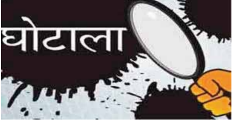
हरिभूमि न्यूज़ | रायपुर