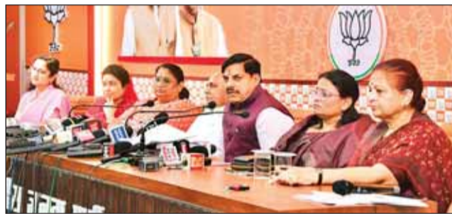
प्रेस कांफ्रेंस के दौरान आगे की रणनीति की जानकारी देते सीएम