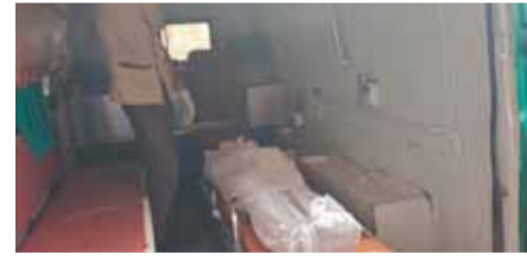
हरिभूमि न्यूज़ | रायगढ़