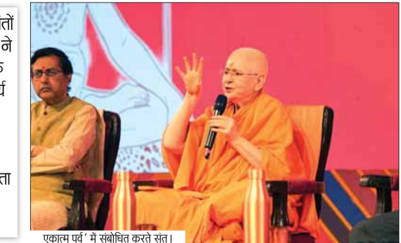
एकात्म पर्व में संबोधित करते संत।