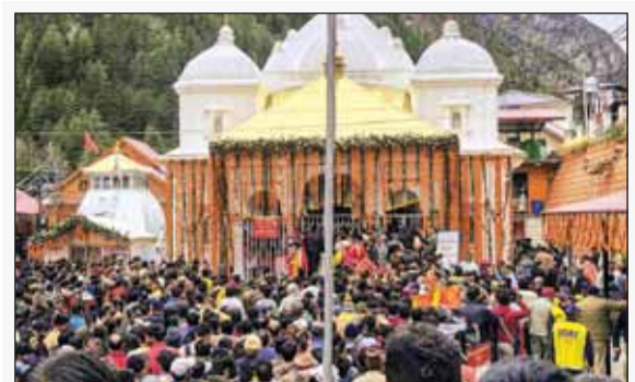
हजारों श्रद्धालुओं की भीड़ भगवान के दर्शन करने पहुंची