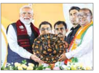
एजेसी भा बंकुरा

बंगाल में गरजे प्रधानमंत्री मोदी, टीएमसी के साथ ही कांग्रेस पर किया बड़ा हमला