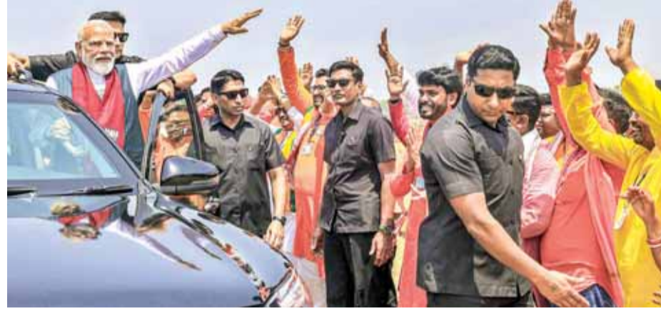
पश्चिम बंगाल में रोड शो के दौरान जनता का अभिवादन करते पीएम मोदी

पीएम मोदी ने कहा कि अगर बंगाल में भाजपा की सरकार बनती है, तो महिलाओं को पांच लाख तक का मुफ्त इलाज मिलेगा। बंगाल की बहनों को हर साल 36,000 रुपये मिलेंगे। गर्भवती महिलाओं को 21,000 रुपए दिए जाएंगे। बेटियों की शिक्षा के लिए 5,000 रुपए देगी। मुद्रा योजना के तहत महिलाओं को स्वरोजगार के लिए 20 लाख रुपए मिलेंगे। कृषि से जुड़ी महिलाओं को सालाना 9,000 रुपये अतिरिक्त मिलेंगे।