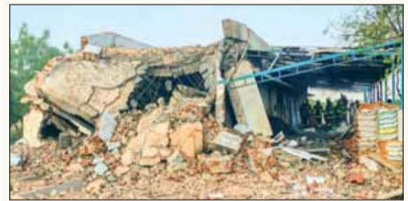
विस्फोट के बाद वनजा पटाखा फैक्ट्री पूरी तरह से क्षतिग्रस्त

केदारनाथ धाम के कपाट 22 को और बद्रीनाथ धाम के कपाट 23 अप्रैल को खुलेंगे देहरादून। अक्षय तृतीया के पावन अवसर पर उत्तराखंड में श्रद्धा और आस्था से जुड़ी चारधाम यात्रा 2026 का विधिवत शुभारंभ हो गया है। इस शुभ दिन पर सबसे पहले गंगोत्री और यमुनोत्री धाम के कपाट श्रद्धालुओं के लिए खोल दिए गए, जिसके साथ ही चारधाम यात्रा का आध्यात्मिक सफर औपचारिक रूप से शुरू हो गया। गंगोत्री में पहली पूजा पीएम मोदी के नाम की हुई, जिसमें मुख्यमंत्री पुष्कर सिंह धामी शामिल हुए। बाबा केदार की डोली भी अपने शैतकालीन गढ़ी स्थल ओकरेश्वर मंदिर से फाटा की ओर रवाना हो गई है। बाबा की पंचमुखी डोली 21 अप्रैल को केदारनाथ पहुंचेगी। केदारनाथ धाम के कपाट 22 अप्रैल को और बद्रीनाथ धाम के कपाट 23 अप्रैल को खोले जाएंगे।