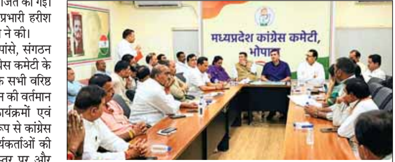
कांग्रेस प्रदेश प्रभारी चौधरी एवं प्रदेश अध्यक्ष पटवारी ने पदाधिकारियों से चर्चा की।