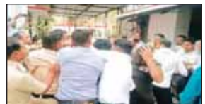
आया था, जिसके आरोपियों को 18 अप्रैल को मह कोर्ट में लाया जा रहा था। इससे पहले कोर्ट परिसर में वकीलों ने चारों ओर से घेर लिया और अचानक सभी एक साथ आरोपियों पर टूट पड़े।

प्रदेश के मह कोर्ट परिसर में गुस्साए वकीलों ने गैंगरेप के आरोपियों को धुनाई कर डाली। मामला इतना बिगड़ा कि आरोपियों को भीड़ से छुड़ाया में पुलिस के पसीने छूट गए। दरअसल, 14 अप्रैल, मंगलवार को बेरछा के जंगल में एक छात्रा से सामूहिक दुष्कर्म का मामला सामने