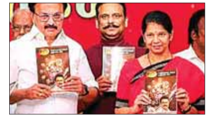
सीएम स्टालिन ने जारी किया द्रविड़ मॉडल 2.0 घोषणापत्र

प्रधानमंत्री ने महिला आरक्षण विधेयक के विरोध को लेकर द्रमुक पर कड़ा प्रहार किया है। पीएम मोदी ने आरोप लगाया कि द्रमुक ने समर्थन करने के बावजूद यू-टर्न ले लिया है। उन्होंने तमिलनाडु की सत्ताधारी पार्टी पर महिला कल्याण की जगह राजनीति को प्राथमिकता देने का आरोप लगाया।